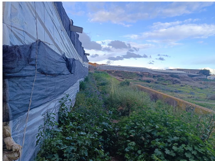
Calle El Salmón