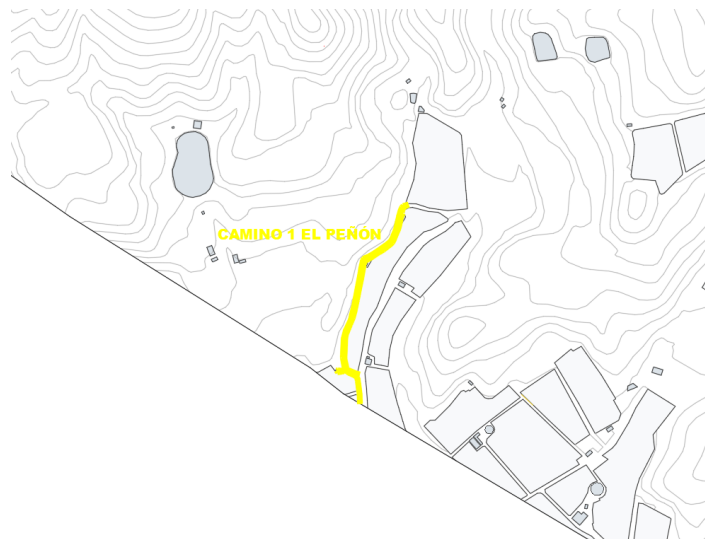
Camino 1 El Peñón