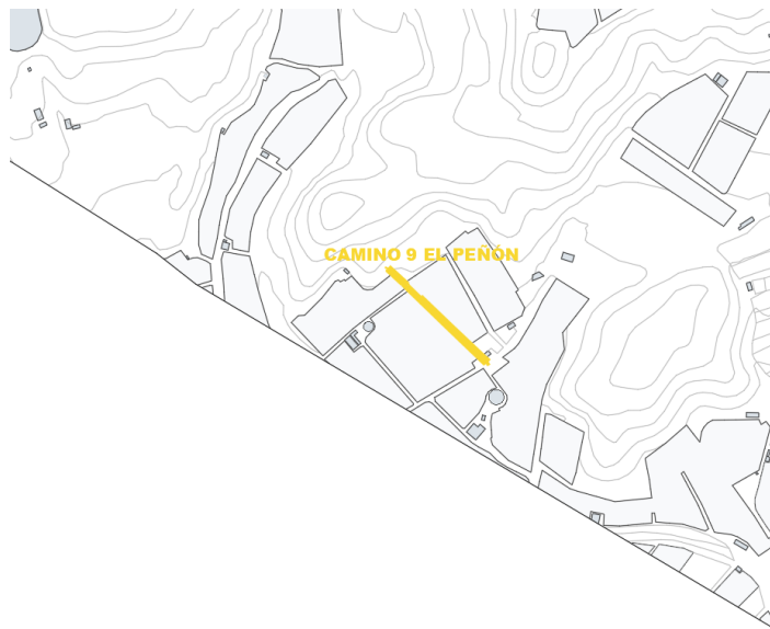
Camino 9 El Peñón