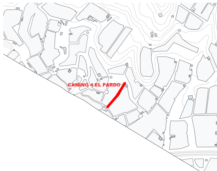
Camino 4 El Pardo