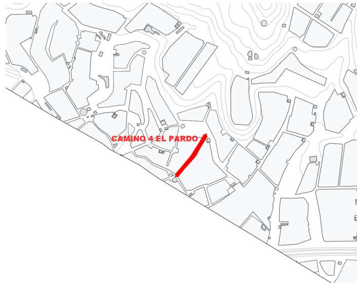
Camino 4 El Pardo