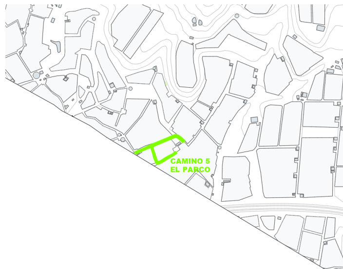
Camino 5 El Pardo