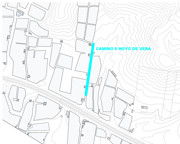
Camino 8 Hoyo de Vera