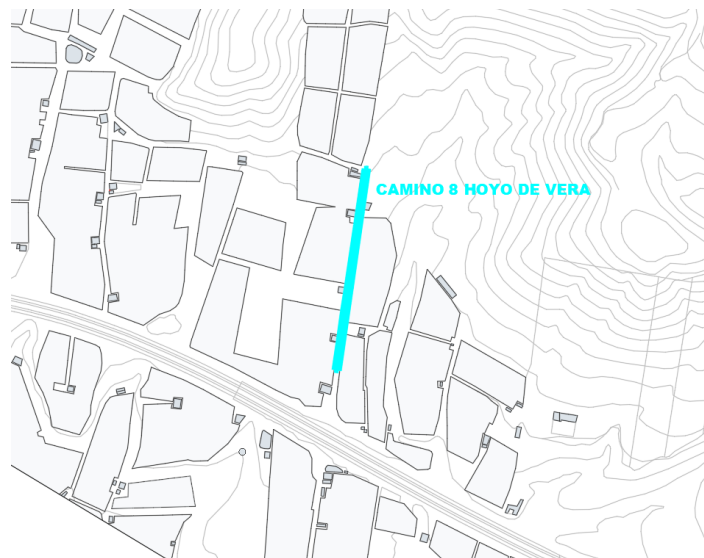
Camino 8 Hoyo de Vera