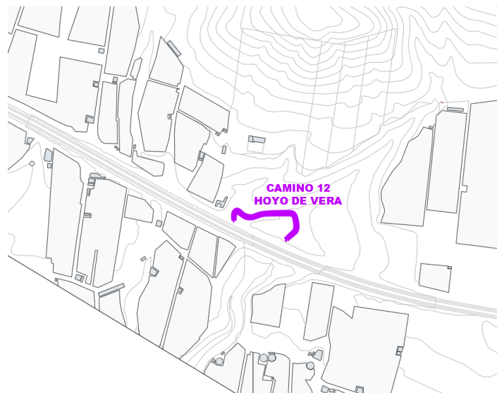
Camino 12 Hoyo de Vera