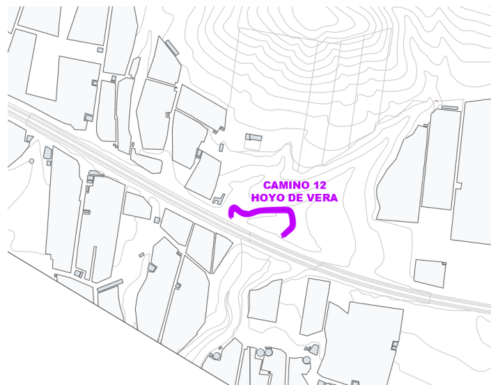
Camino 12 Hoyo de Vera