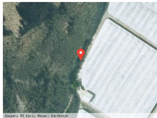
Imagery © Esri, Maxar, Earthstar Vista Satélite (Zoom)