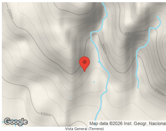
Map data ©2026 Inst. Geogr. Nacional Vista General (Terreno)