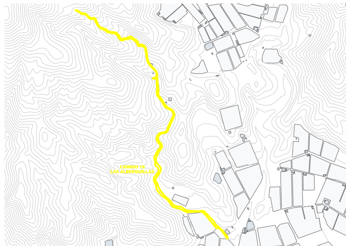
Camino 18 Las Alberquillas