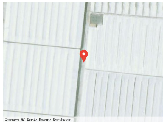
Vista Satélite (Zoom)