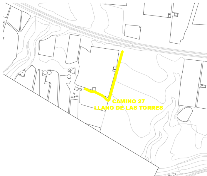
Camino 27 Llano de las Torres