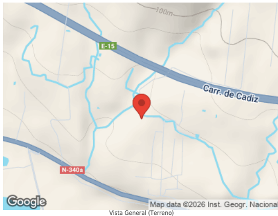
Map data ©2026 Inst. Geogr. Nacional Vista General (Terreno)