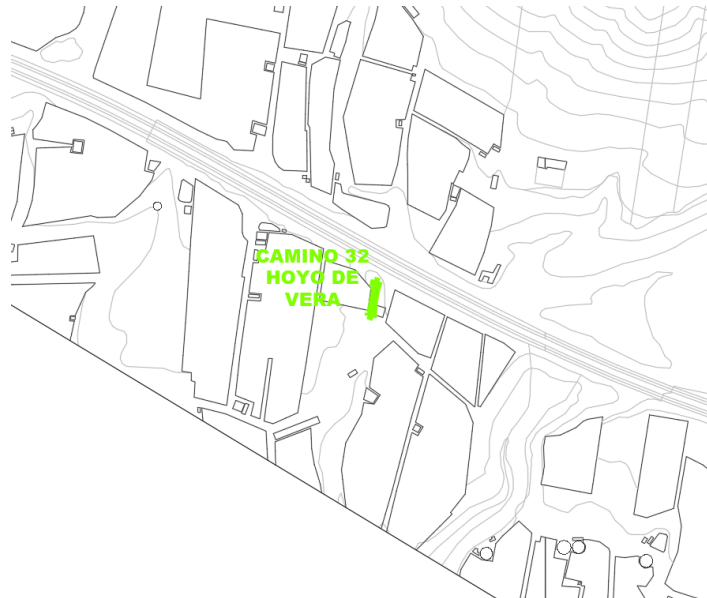
Camino 32 Hoyo de Vera