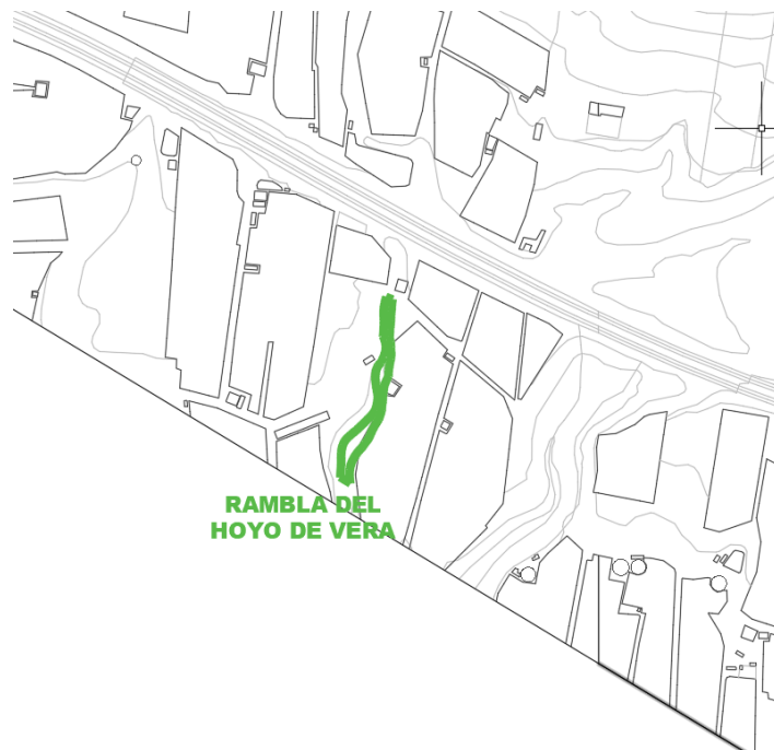
Rambla del Hoyo de Vera