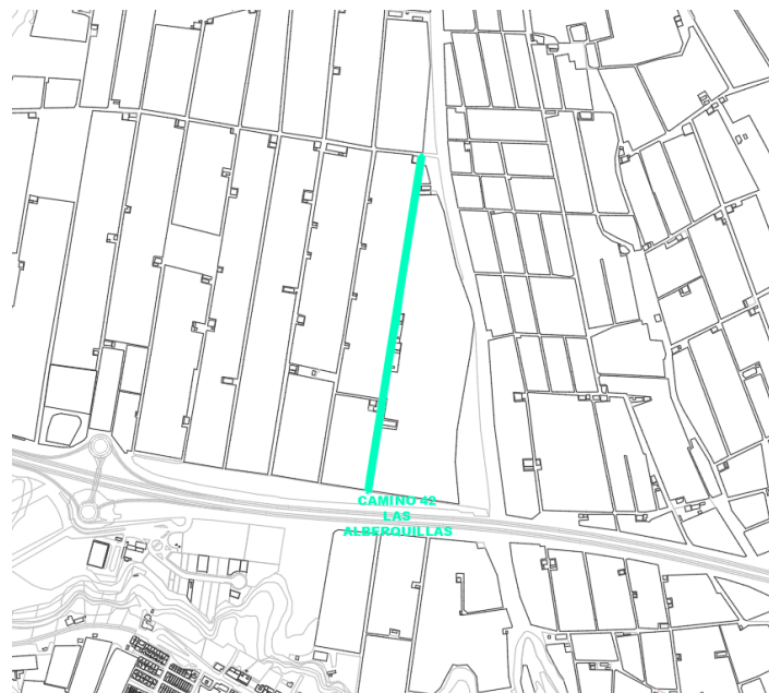
Camino 42 Las Alberquillas