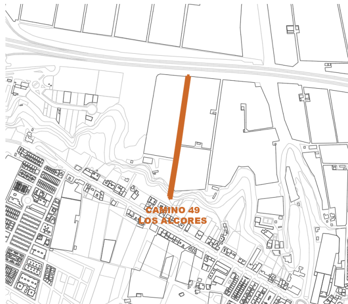
Camino 49 Los Alcores