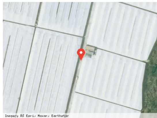
Vista Satélite (Zoom)