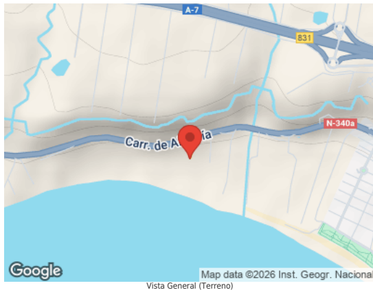
Map data ©2026 Inst. Geogr. Nacional Vista General (Terreno)