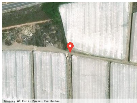
Vista Satélite (Zoom)