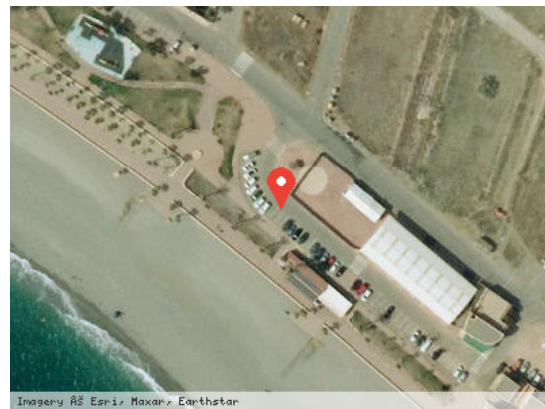
Imagery © ESRI, Maxar, Earthstar Vista Satélite (Zoom)