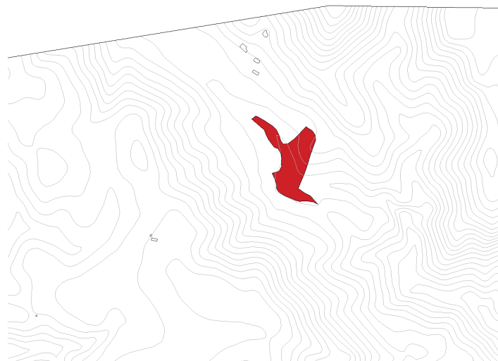
Finca rústica en Polígono Infante