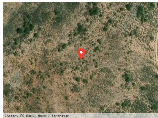
Imagery ©S. Earthstar, Earthstar Vista Satélite (Zoom)