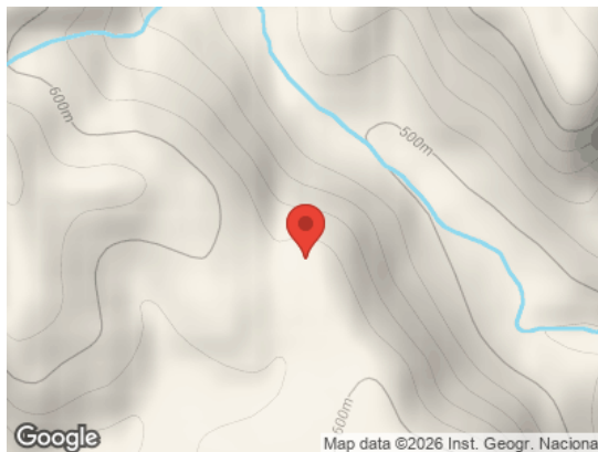
Map data ©2026 Inst. Geogr. Nacional Vista General (Terreno)