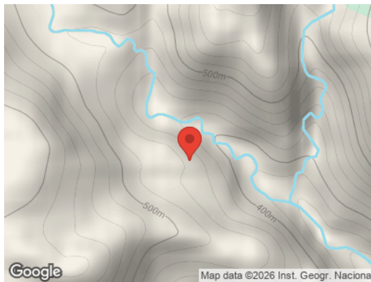
Map data ©2026 Inst. Geogr. Nacional Vista General (Terreno)