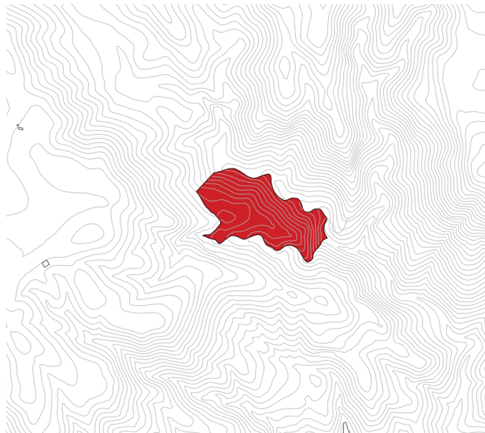
Finca rústica en Polígono Las Alberquillas