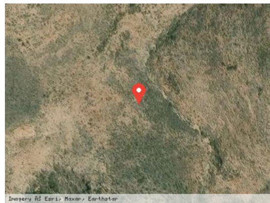
Vista Satélite (Zoom)