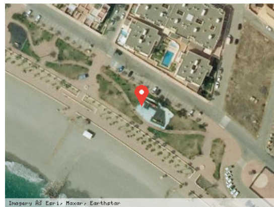
Vista Satélite (Zoom)